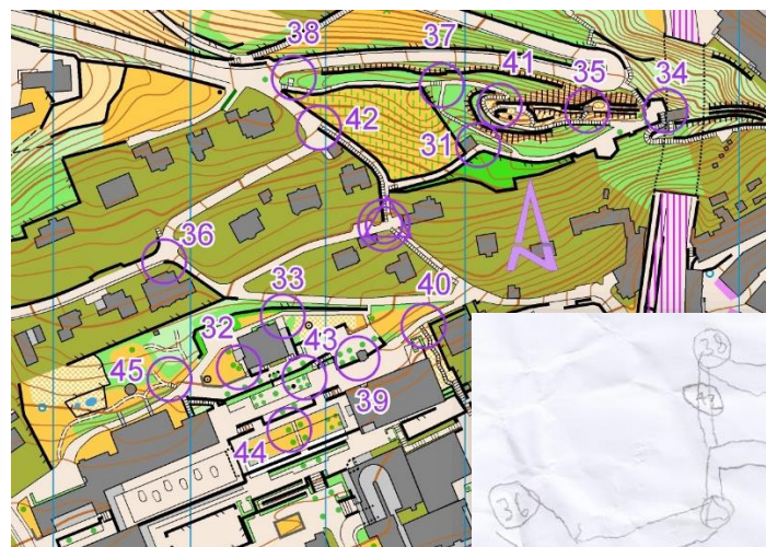
Beispiele Schulsport Stadt Baden 2025